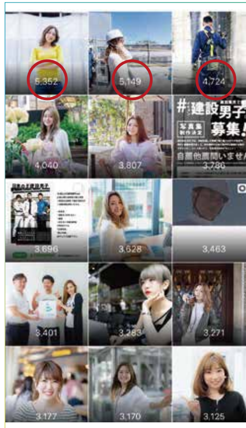
記事を投稿した際の インプレッション数