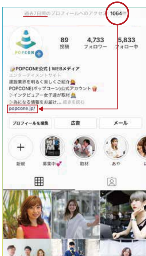
SNS からメディアへ誘導